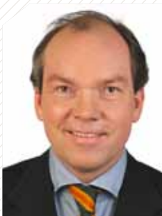
Dr. Philipp Murmann, Mitglied des Deutschen Bundestages (MdB)